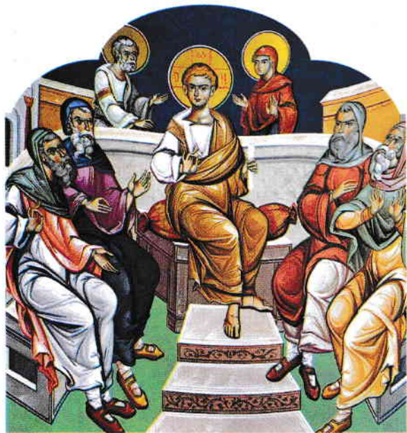
Iisus Hristos le-a vorbit învățătorilor în casa lui Dumnezeu.