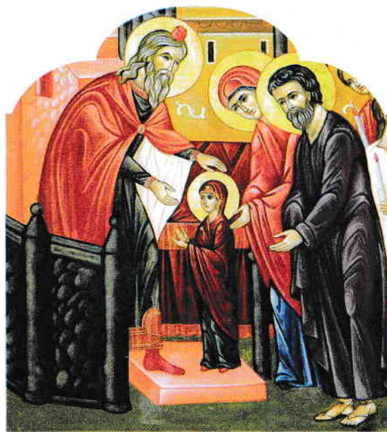
Maica Domnului a stat de la trei ani în locașul sfânt din Ierusalim.